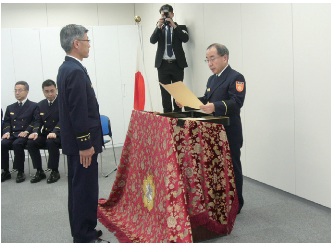
稲山消防庁長官から消防本部代表者へ賞状を贈呈