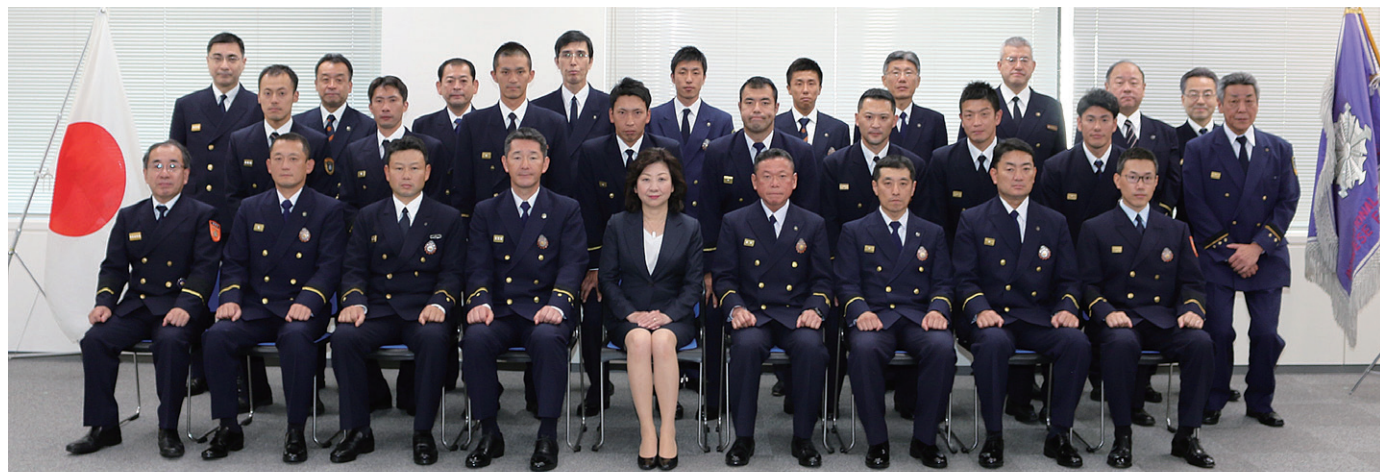
野田総務大臣（前列中央）、稲山消防庁長官（前列左端）、緒方消防庁次長（後列左端）、杉本国民保護防災部長（後列右端）、その他は、国際緊急援助隊員の皆様と隊員を派遣した各消防本部の皆様