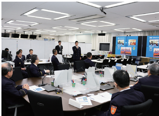
隊員から派遣に関するコメント